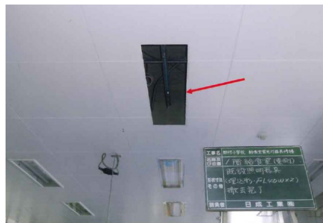
② 既設照明器具撤去